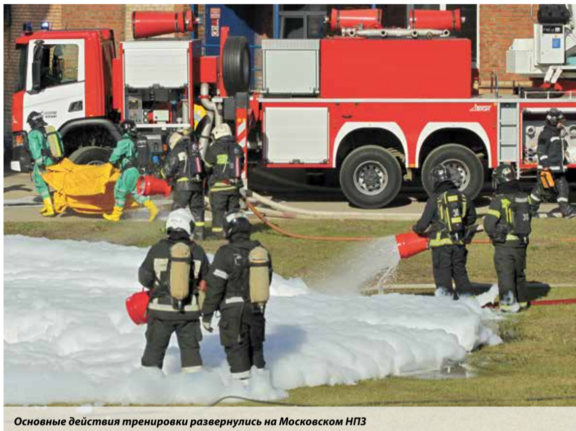
Основные действия тренировки развернулись на Московском НПЗ

Тренировка по всей стране прошла в два этапа. Первоначально отрабатывались вопросы оповещения и сбора руководящего состава, работников органов, осуществляющих управление РСЧС и ГО, развертывания системы управления на всех уровнях.