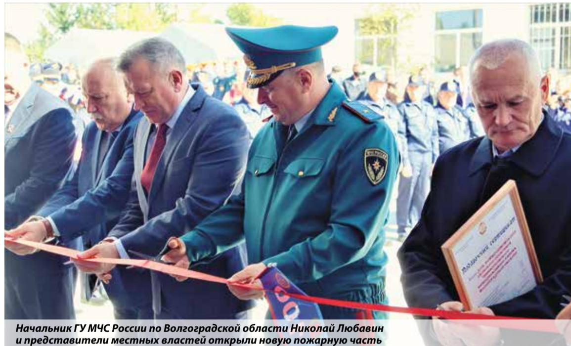
Начальник ГУ МЧС России по Волгоградской области Николай Любавин и представители местных властей открыли новую пожарную часть

на закупку пожарных автомобилей и тракторов с емкостями и мотопомпами. Эта та