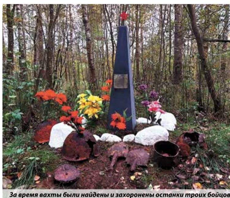
За время вахты были найдены и захоронены останки троих бойцов

Но самые интересные находки связаны, конечно,