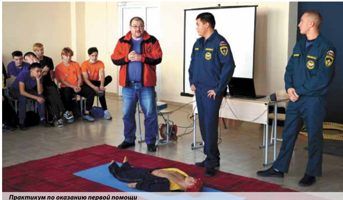
Практикум по оказанию первой помощи

— Все мы с вами коллеги, все работаем с детьми. Для меня это большая радость, потому что не представляю себя