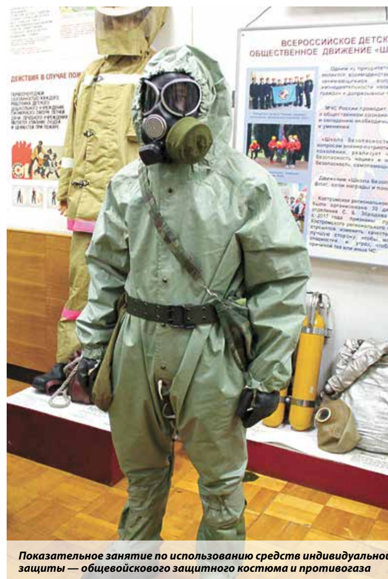
Показательное занятие по использованию средств индивидуальной защиты — общевогойского защитного костюма и противогаза