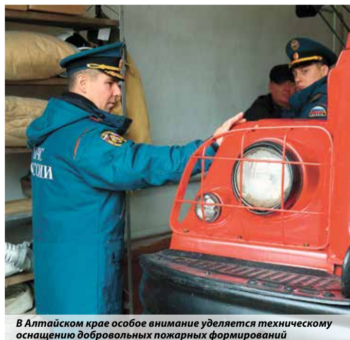
В Алтайском крае особое внимание уделяется техническому оснащению добровольных пожарных формирований

Анна Обиденко, пресс-служба ГУ МЧС России по Алтайскому краю