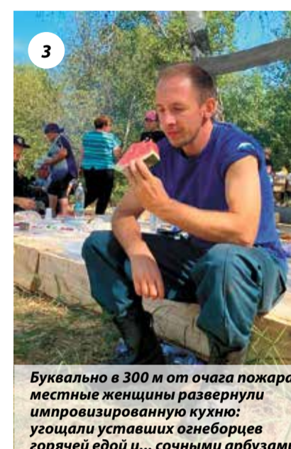
3 Буквально в 300 м от очага пожара местные женщины развернули импровизированную кухню: угощали уставших огнеборцев горячей едой и... сочными арбузами