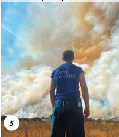
4 Пустили встречный пал. Все горит, дым поднимается до небес, смешиваясь с облаками. Страшно и в то же время красиво