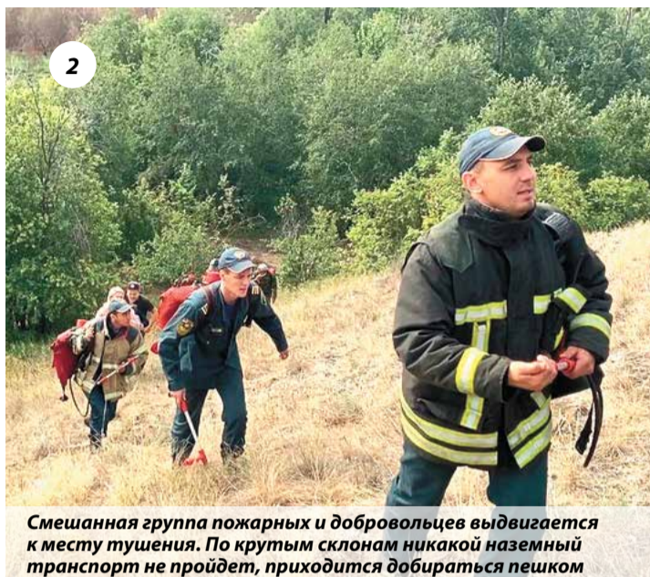
2 Смешанная группа пожарных и добровольцев выдвигается к месту тушения. По крутым склонам никакой наземный транспорт не пройдет, приходится добираться пешком