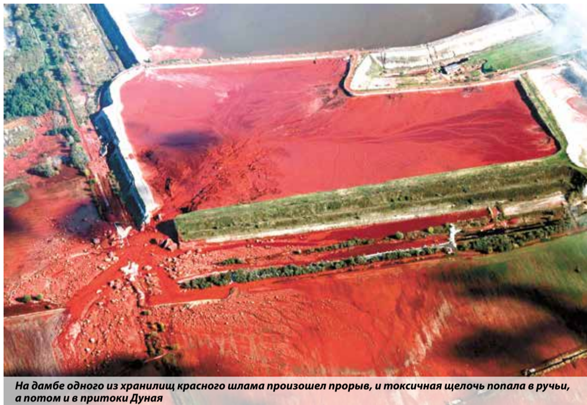
На дамбе одного из хранилищ красного шлама произошел прорыв, и токсичная щелочь попала в ручьи, а потом и в притоки Дуная

Всего пострадали территории трех областей (Веспрем, Ваш и Дьер-Мошон-Шопрон). В районе бедствия властями было объявлено чрезвычайное положение. Управле-