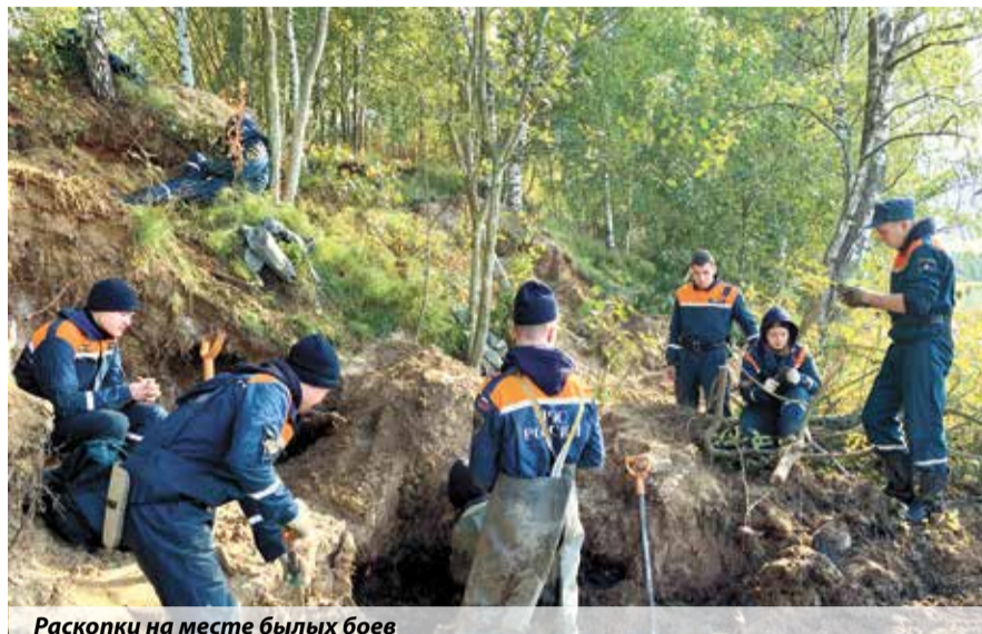
Раскопки на месте бывших боев

Лагерь отряда находился на правом фланге Невского пятачка в 300 м от мемориала, в районе урочища Арбузово, рядом с мемориалом «Призрачная деревня». Он установлен в память о нескольких десятках деревень и поселков, уничто-