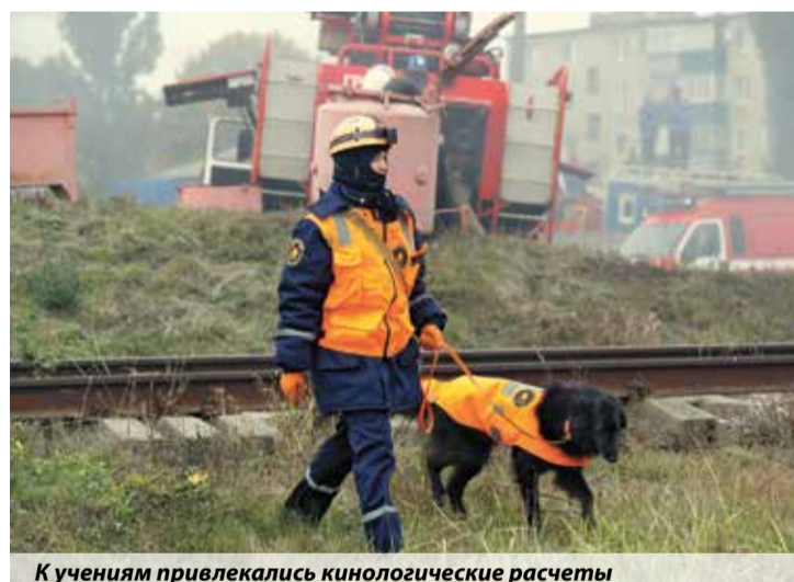
К учениям привлекались кинологовические расчеты