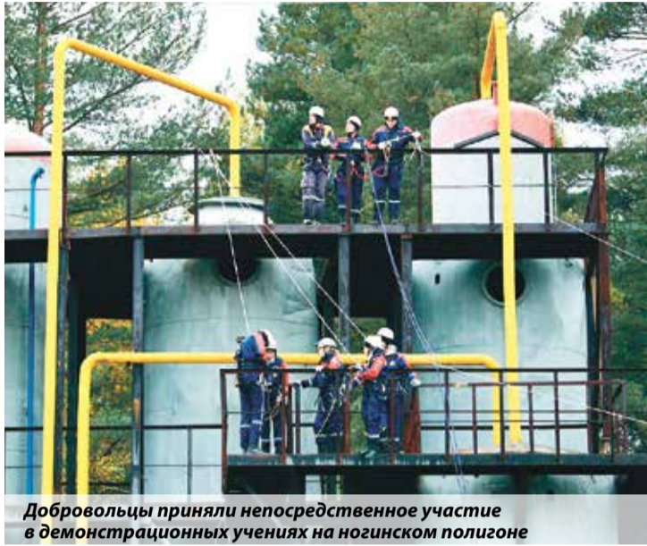
Добровольцы приняли непосредственное участие в демонстрационных учениях на ногинском полигоне

На мероприятии работали порядка 150 инструкторов со всей страны — профессиональные пожарные, психологи, кинологи, которые на безвозмездной основе занима-