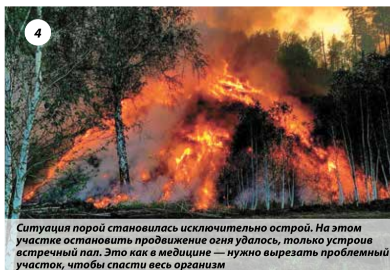
4 Ситуация порой становилась исключительно острой. На этом участке остановить продвижение огня удалось, только устроив встречный пал. Это как в медицине — нужно вырезать проблемный участок, чтобы спасти весь организм