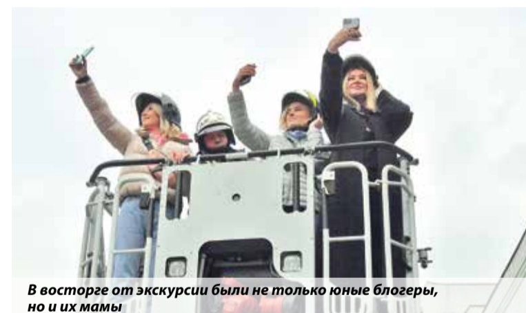
В восторге от экскурсии были не только юные блогеры, но и их мамы