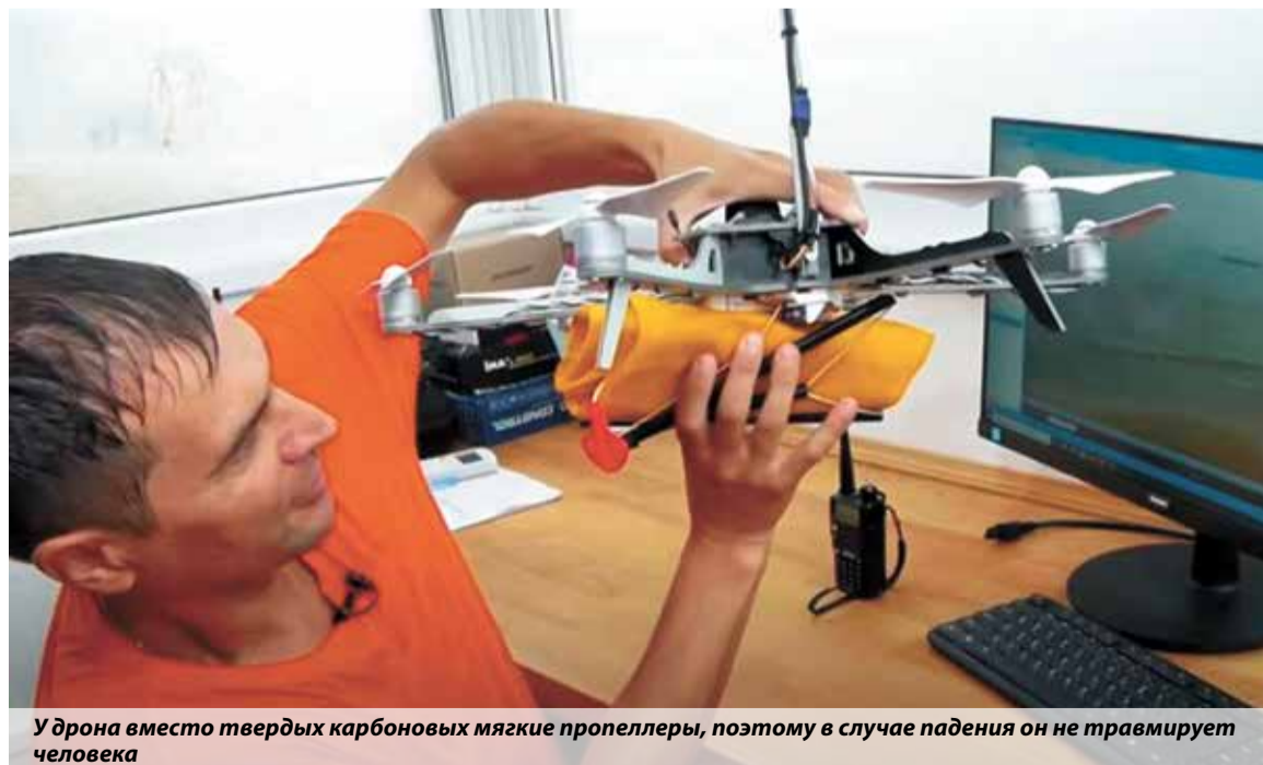
У дрона вместо твердых карбоновых мягкие пропеллеры, поэтому в случае падения он не травмирует человека

Анна Семак, пресс-служба ГУ МЧС России по Краснодарскому краю Фото «Анапа-регион»