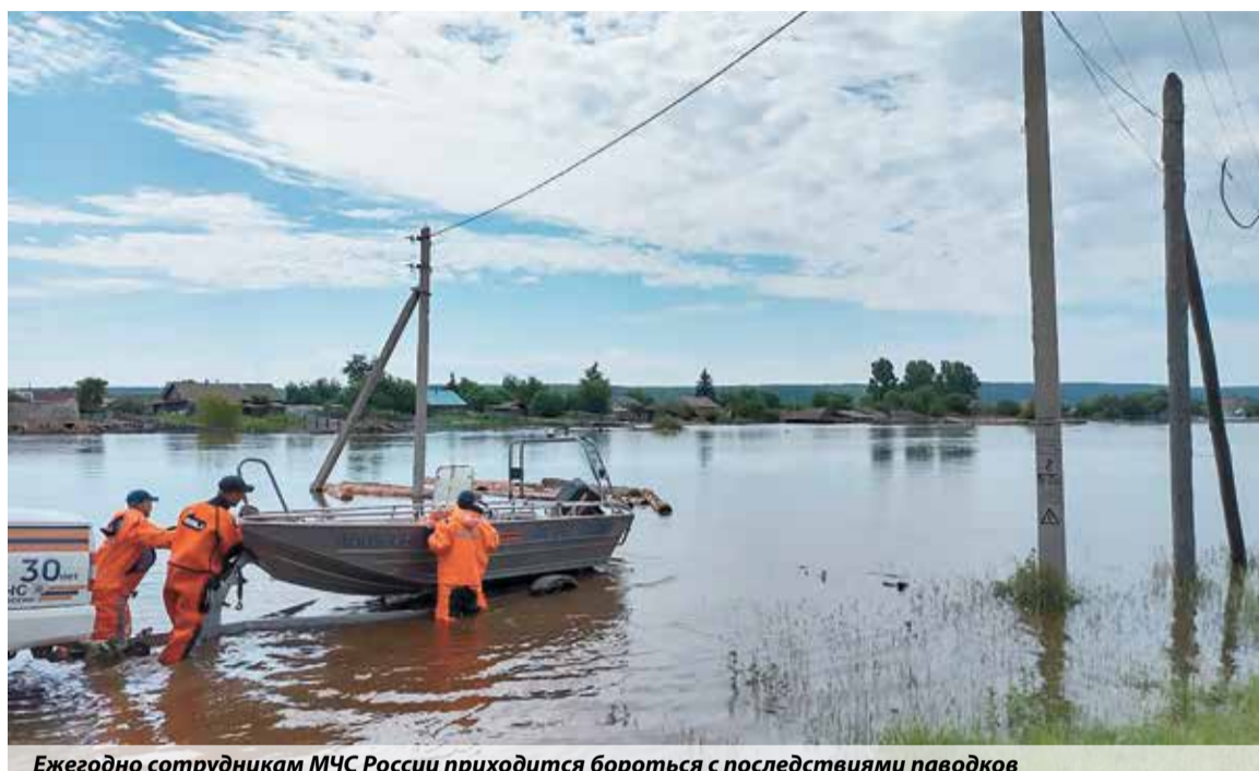
Ежегодно сотрудникам МЧС России приходится бороться с последствиями паводков

К нарушителям применяются меры административного воздействия, вплоть до приостановки. Так, в этом году по решению судов приостанавливалась эксплуатация девяти