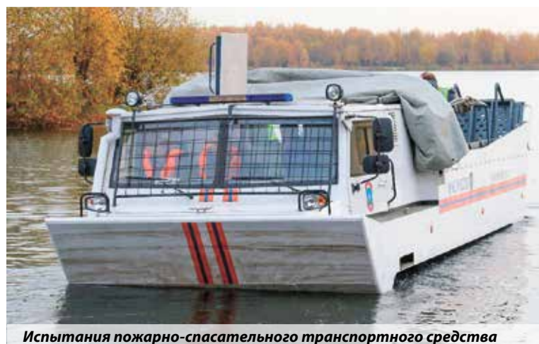
Испытания пожарно-спасательного транспортного средства

✓ 30 национальных стандартов разработаны институтом за последние пять лет по требованиям к аварийно-спасательному инструменту и спасательным технологиям.