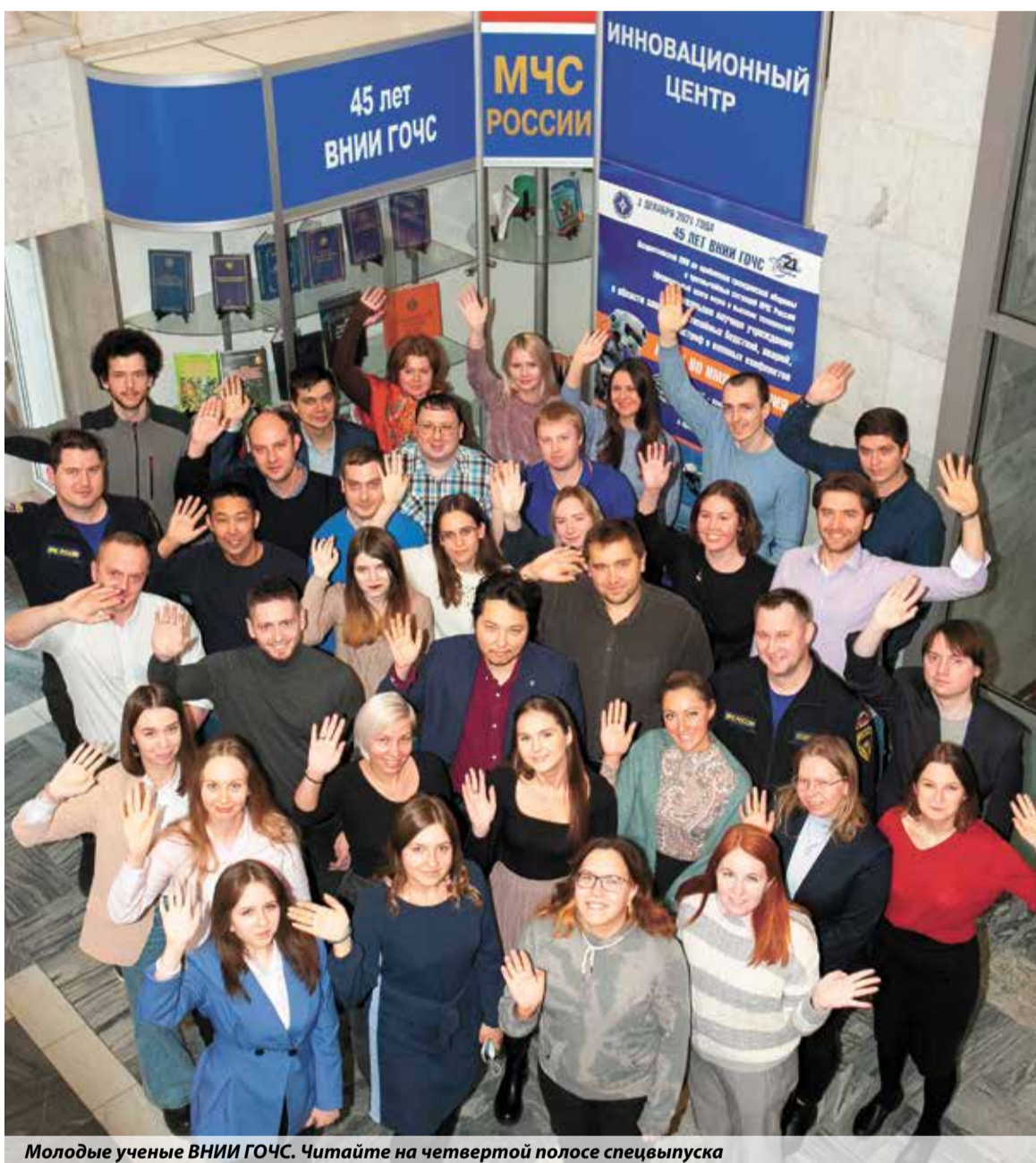
Молодые ученые ВНИИ ГОЧС. Читайте на четвертой полосе спецвыпуска