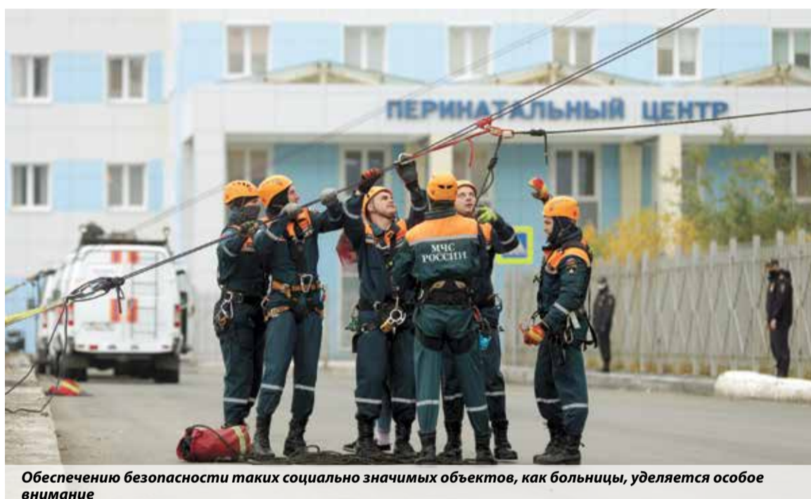
Обеспечению безопасности таких социально значимых объектов, как больницы, уделяется особое внимание

объектов здравоохранения и отдельных помещений. Кроме того, с начала года к административной ответственности привлечено более двух тысяч юридических и около трех тысяч должностных лиц. Еще около 1,5 тысячи дел об адми-