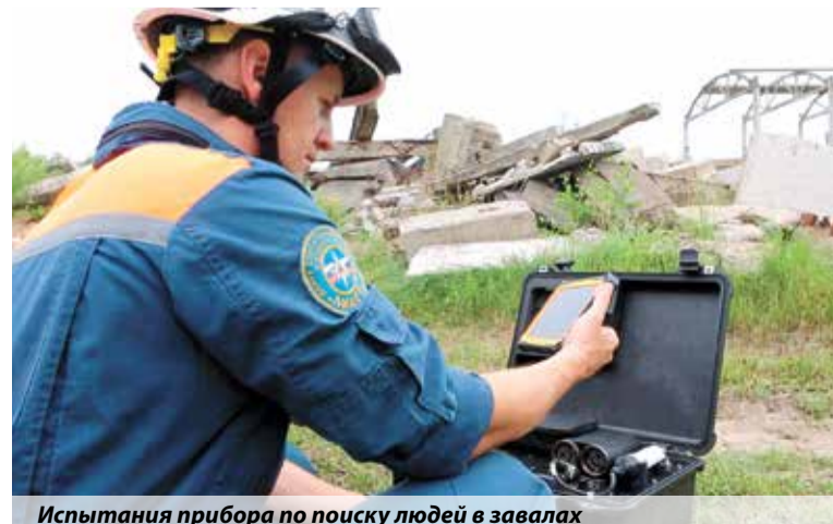
Испытания прибора по поиску людей в завалах